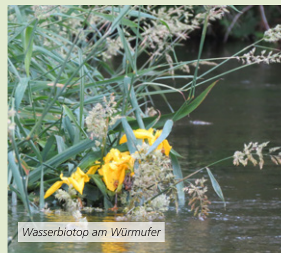
Wasserbiotop am Würmufer