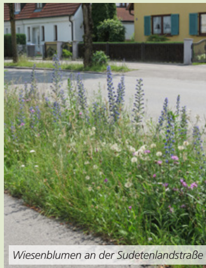
Wiesenblumen an der Sudetenlandstraße