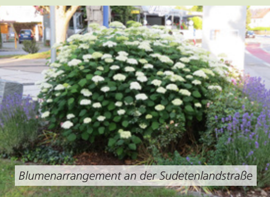
Blumenarrangement an der Sudetenlandstraße