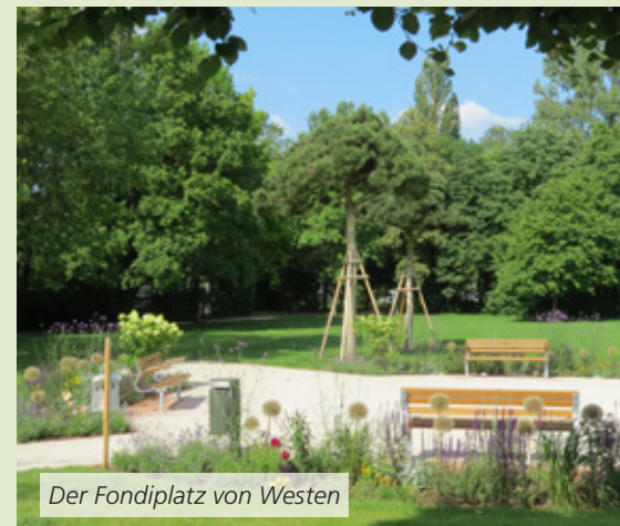
Der Fondiplatz von Westen