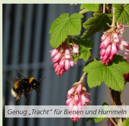
Genug „Tracht“ für Bienen und Hummeln