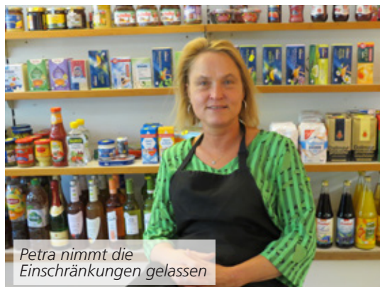
Petra nimmt die Einschränkungen gelassen

Was ist im Geschäft anstrengender geworden? Die Abstände halten, die Kunden auf die Abstände hinweisen, nach dem Kaffeetrinken den Tisch und alles