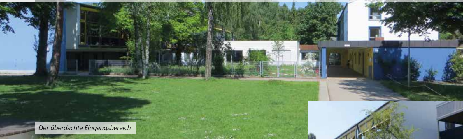
Der überdachte Eingangsbereich