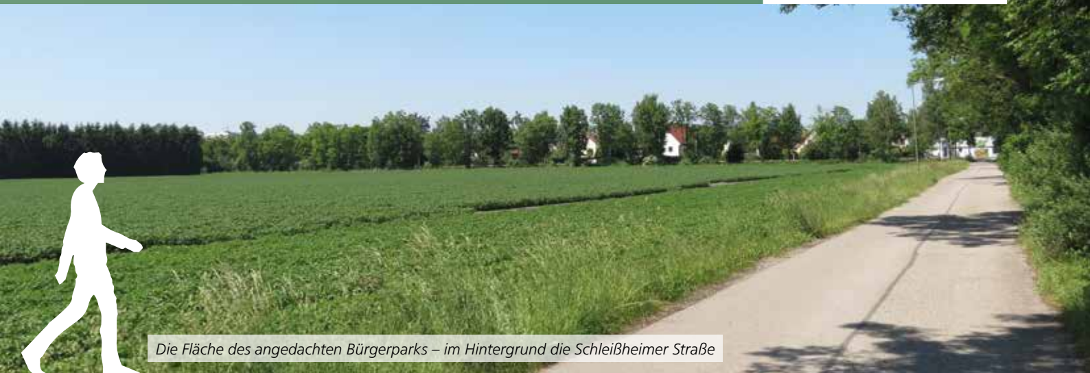
Die Fläche des angedachten Bürgerparks – im Hintergrund die Schleißheimer Straße