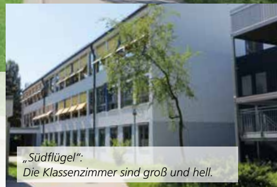
„Südflügel“: Die Klassenzimmer sind groß und hell.