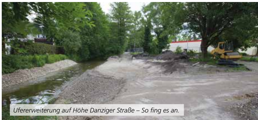
Ufererweiterung auf Höhe Danziger Straße – So fing es an.