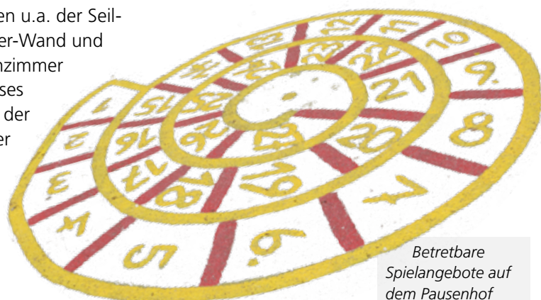
Betretbare Spielangebote auf dem Pausenhof