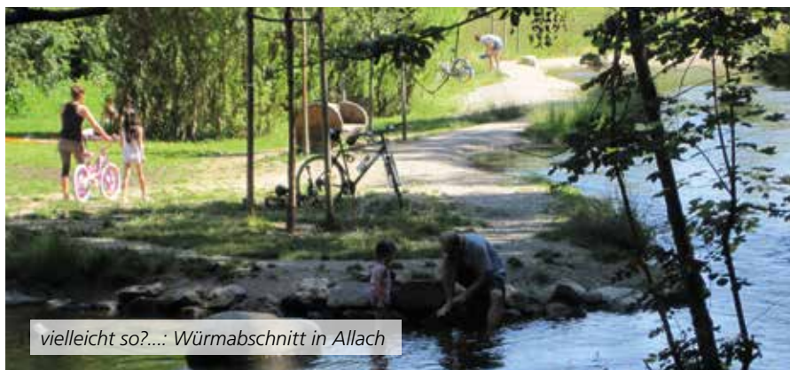
vielleicht so?...: Würmabschnitt in Allach