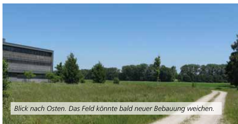
Blick nach Osten. Das Feld könnte bald neuer Bebauung weichen.