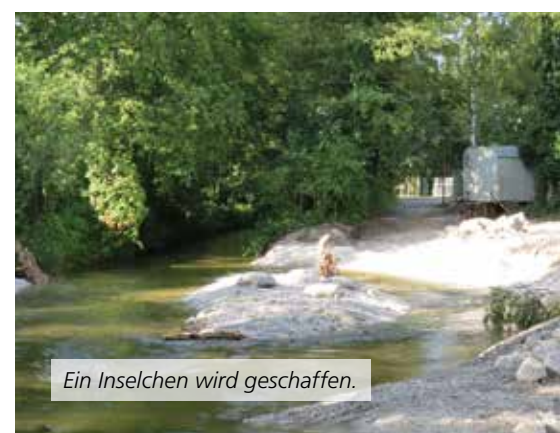
Ein Inselchen wird geschaffen.

Der Kleinkinderspielplatz an der Königsberger Straße wird komplett umgestaltet. Es entstehen eine Sandspielfläche und eine Spielplattform mit verschiedenen