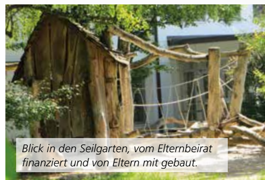
Blick in den Seilgarten, vom Elternbeirat finanziert und von Eltern mit gebaut.

Unterricht näherzubringen, wurde ein Vertrag abgeschlossen, der Lehrern und Kindern der 3. und 4. Klassen die Nutzung von Tablet-PCs mit einer Lernsoftware ermöglicht.