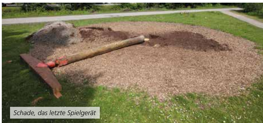
Schade, das letzte Spielgerät