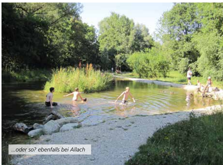
...oder so? ebenfalls bei Allach